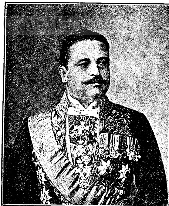
Stoilov, prim-ministru al Bulgariei.

1 V. Alecsandri, Opere complete. Teatru. Vol. I. Prefața pag. XIX sequ.