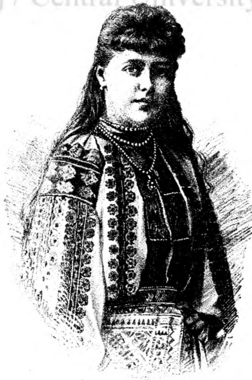
PRINCESA MARIA A ROMÂNIEI.