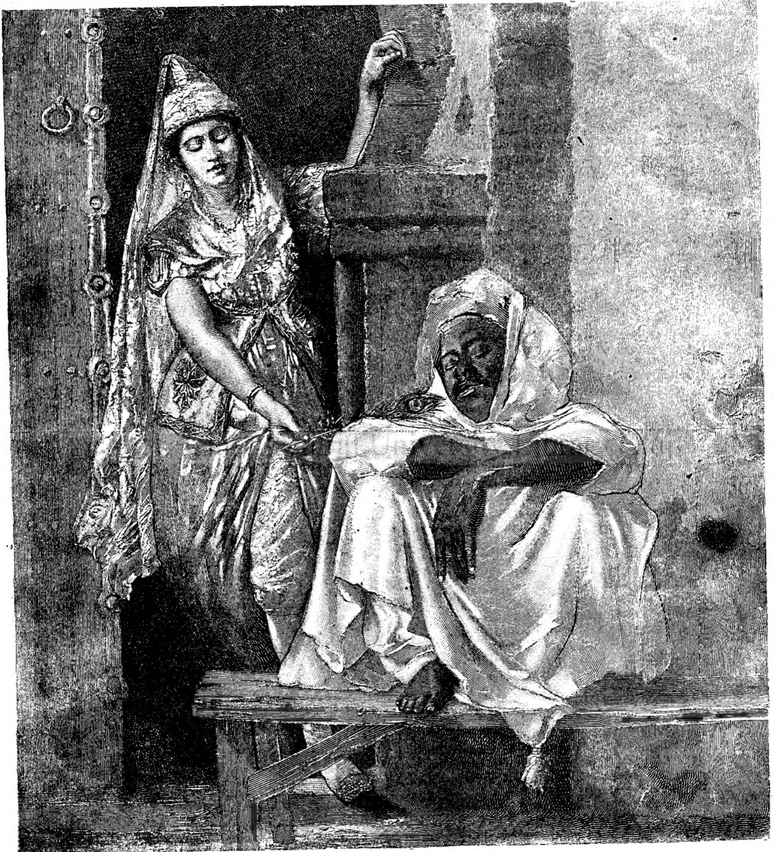
O scenă din Harem.