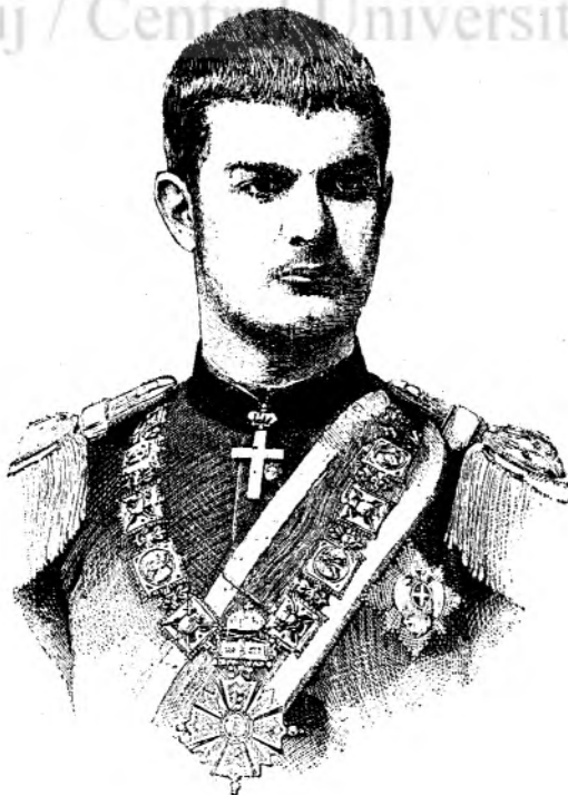
ALESANDRU I, REGELE SERBIEI.

dar jumétate din acei bani aruncați erá munca lui, erau mângăerea și fericirea lui. Dar hainele pe cari i le cumpérá cu d'asila, luminările de Paște, discurile, miruéla, căci il ducea de guler la biserică... dar cutia bisericiei de care il erá spaimă... El le-a făcut lámuri socotéla: mésa, creditul și numele stăpânului seu il dau mai puțin decât il luau mila stăpânului, hainele