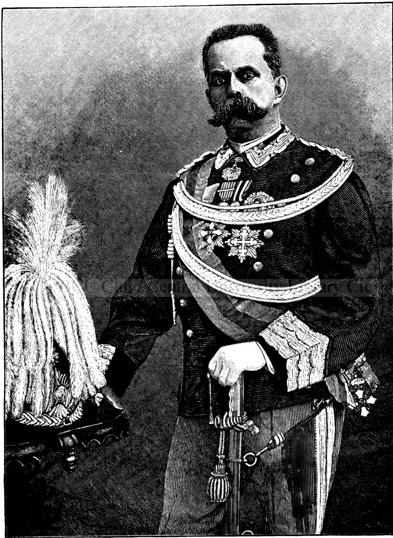
Umberto I, regele Italiei.