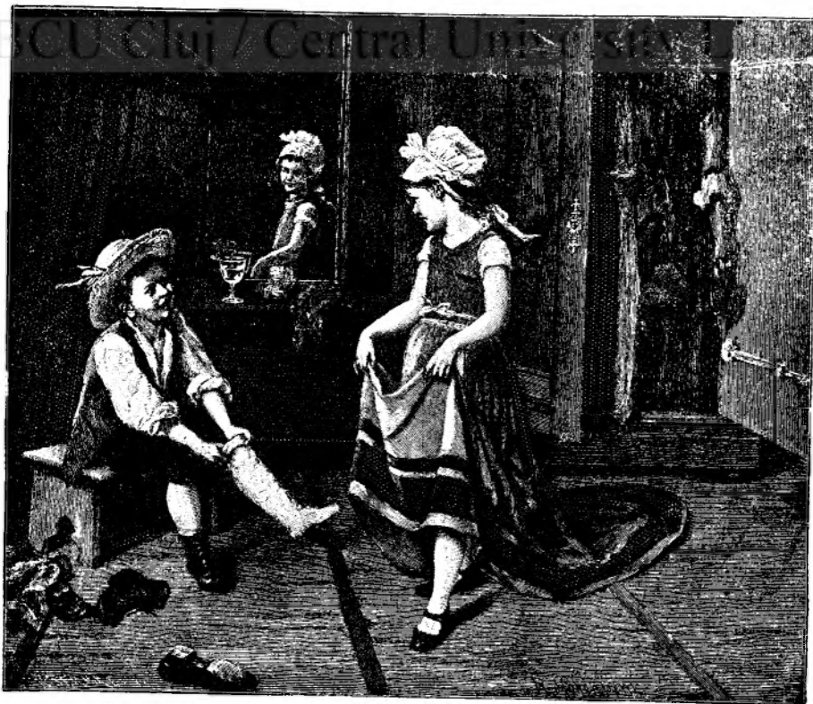
PROBA DE DANS.

— Apoi, na; ești de tot poznașă și dta: prea des vrei să vie, că dór nu-i de tot copacul câte un lup. Ia