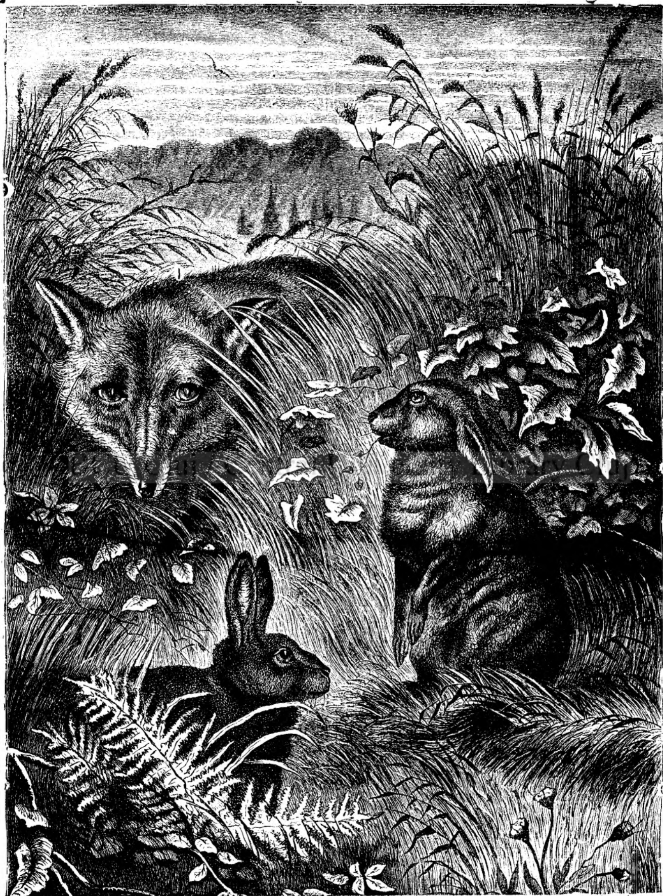
L A P Â N D Ț .