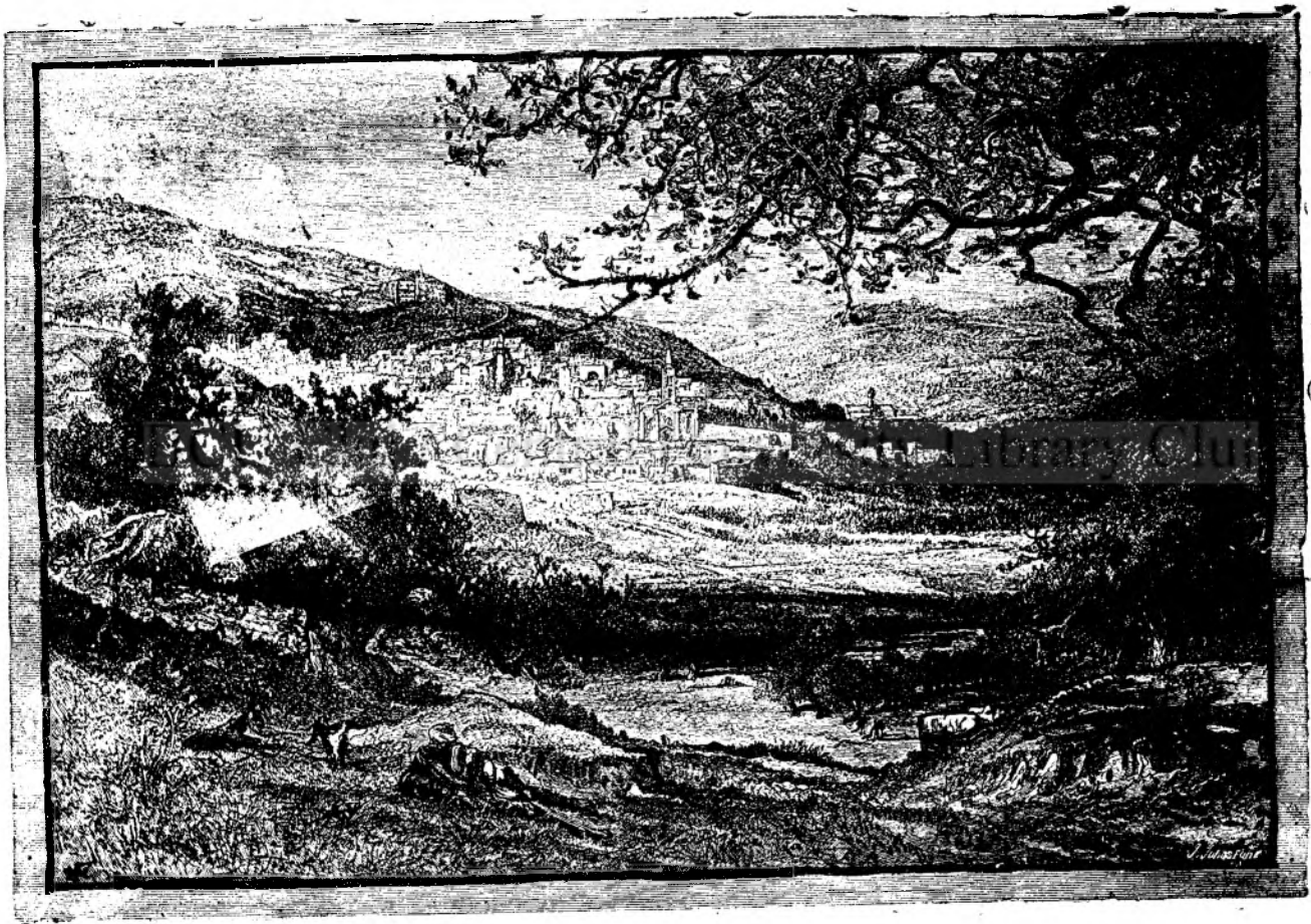
Nazareth de oătră miédăđl.

Grațiile suplinesc frumseța și se simt mai bine decât se exprimă: acesta este un secret minunat și un fel de mister în natură. O femeie place; îi percurgem cu de-ameruntul tóte trăsăturile sale: ea nu