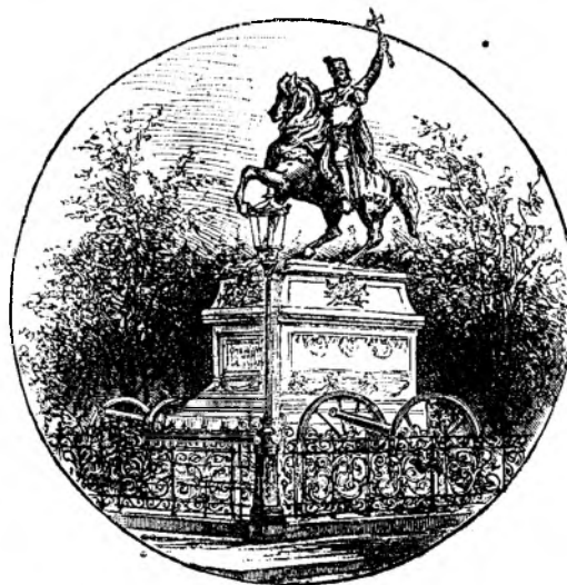
Statua lui Mihai Viteazul în București.

Din fiecare ținut să se adune îmbrăcămintele bărbătești și femeiești, ce sunt în us pentru patru vârste de oameni, anume: a) de prunc dela 5-12 ani; b) de june; c) de bărbat și d) unde este deosebire, și de moș; astfel și pentru genul femeiesc: a) de fetiță; b) de fată mare; c) de nevastă și d) de babă bătrână;