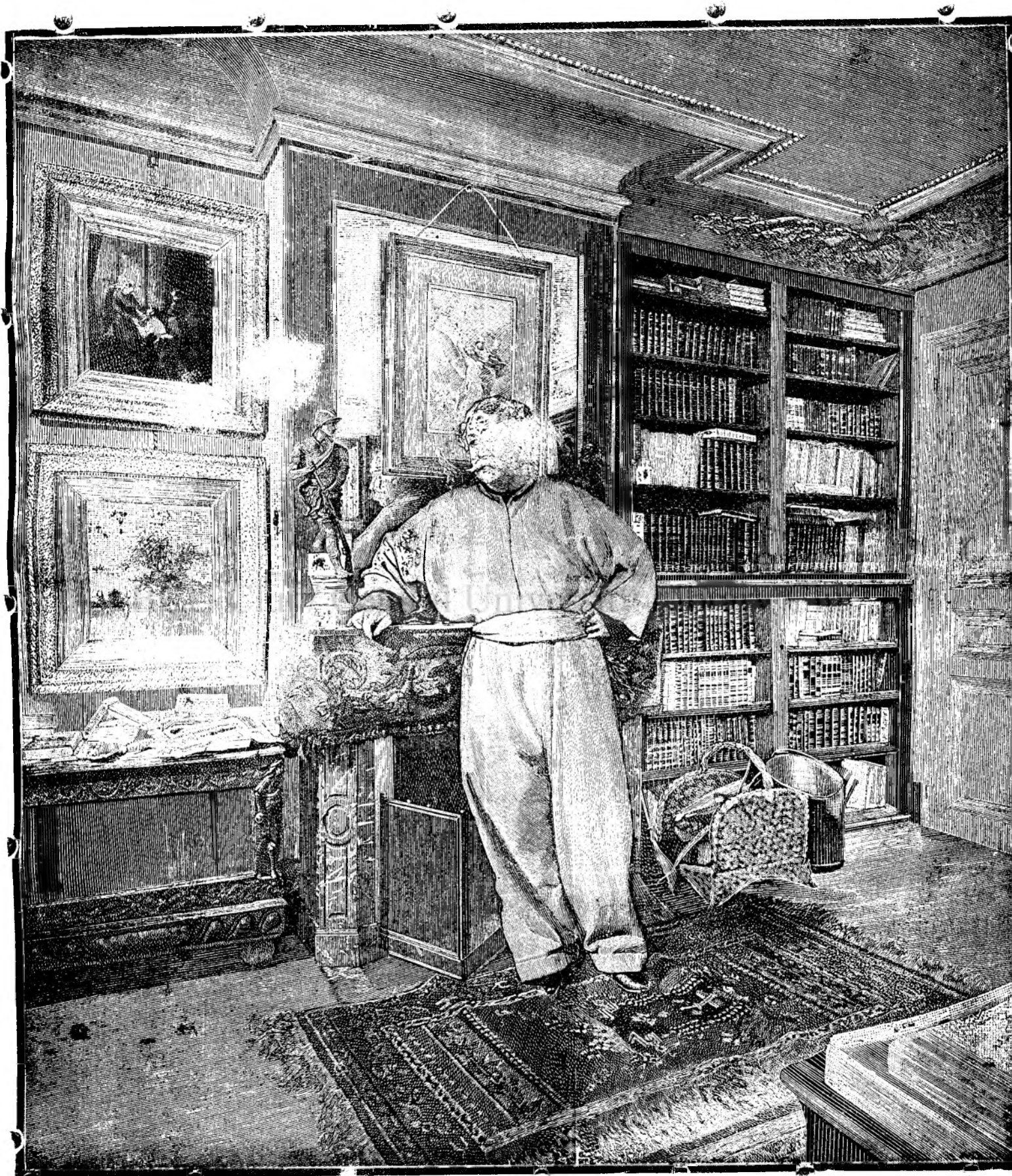
ALESANDRU DUMAS ACASĂ.