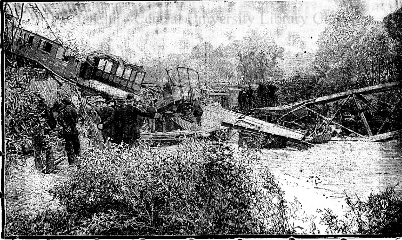
CATASTROFA PE CALEA FERATĂ DELA MÖNCHENSTEIN.