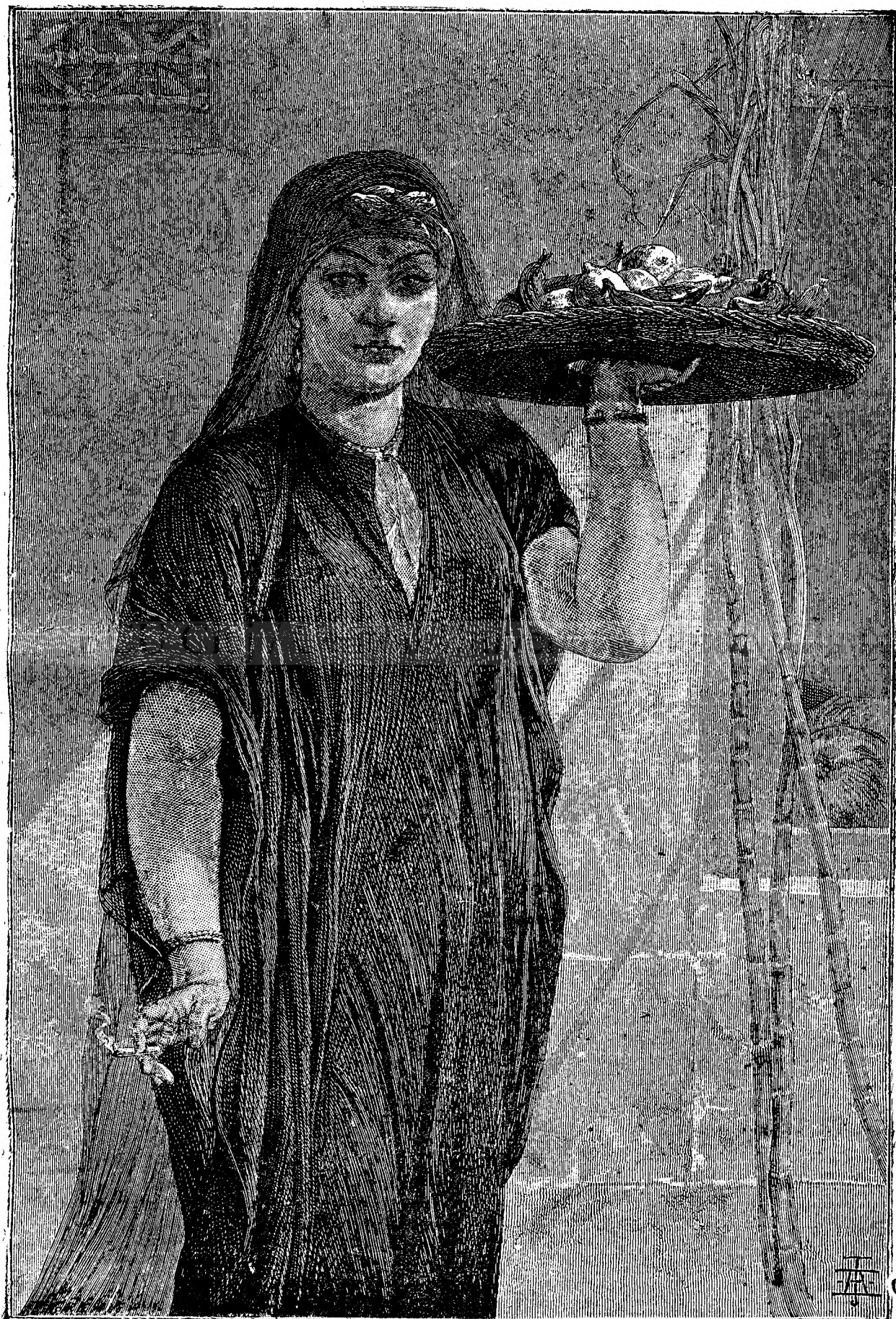
Precupeță de pome in Orient.