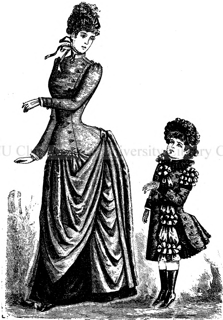
Costum de stradă.