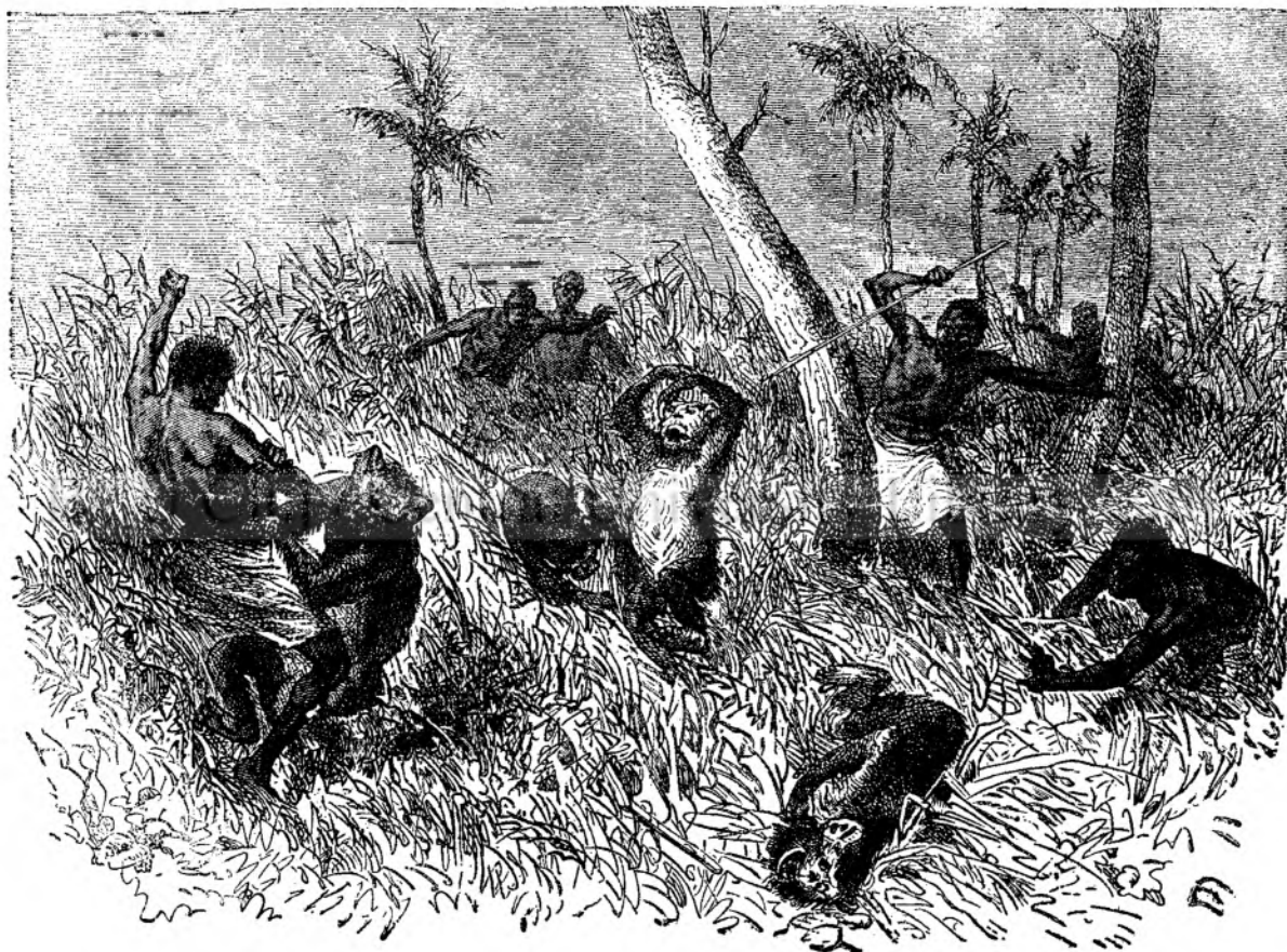
Vênătore de soco-moime.

Etă negreșit ceea ce ar bine-merită tîte simpatiele publicului turist, amator, artist ori simplu muritor. Unii vor gâsi lucruri cari să le deștepte și să le ficeze a-mintirile; alții, cari — arătându-le frumusețea plaiurilor nîstre — să le ațite dorul d'a-și cercetă și țera, mai lăsând d'oparte ale străinetați; artiștii vor gâsi modele frumîse, er cei mai mulți, mulțamită acestor