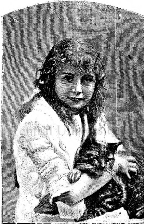
A m i c i a.

Ostașul ia pe fêta 'mpêratului de soție, făcând un ospêț ca acela de puteai innodă in zamă lungă să le ajungă; zamă grósă tótă óse.