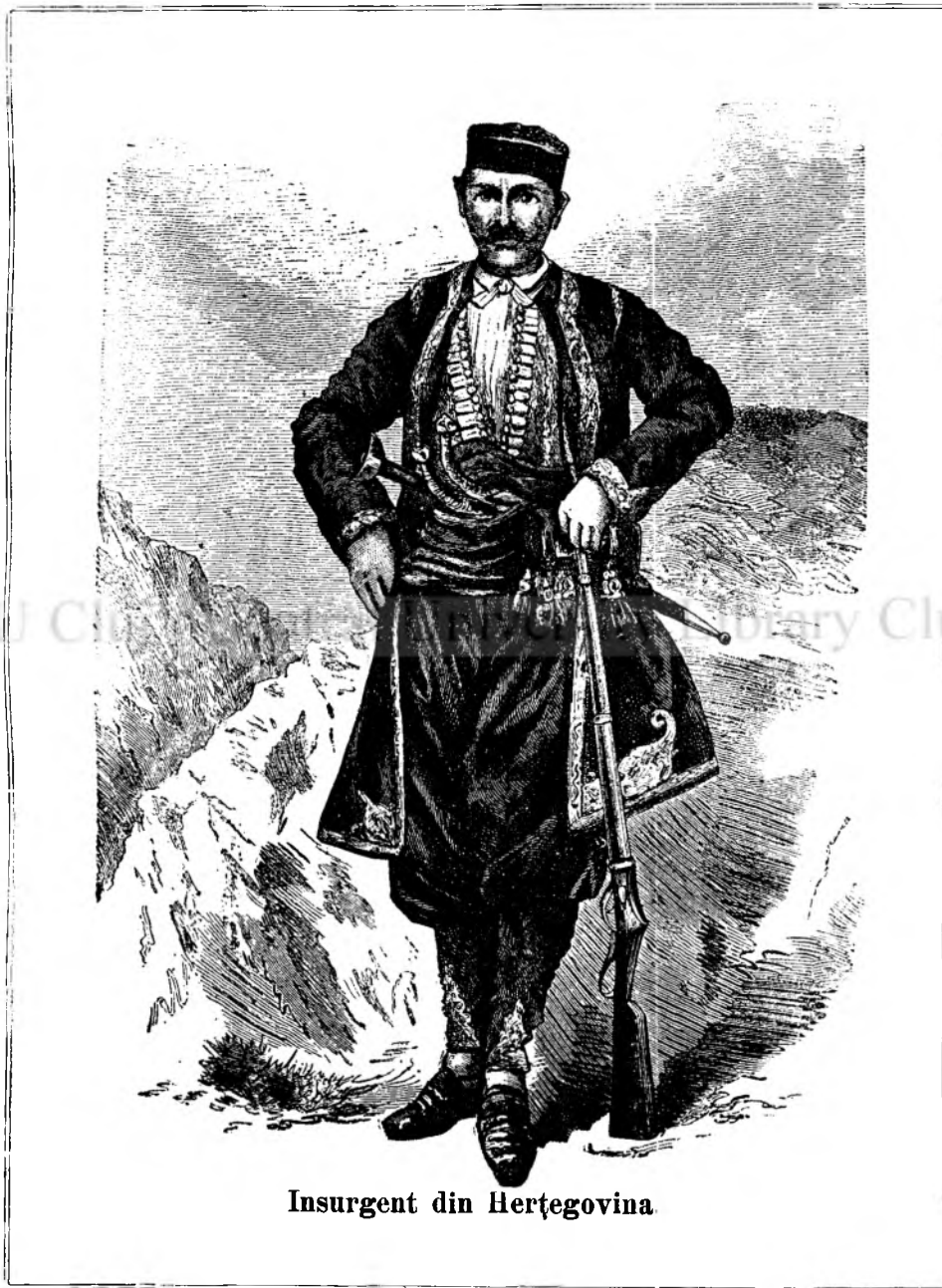
Insurgent din Herțegovina.

tot așa trei magie, una naturală, una cerescă și una religioasă seu ceremonială. Cele patru elemente posed proprietăți miraculoase; focul pământesc e reflexul celui ceresc; aerul e un spectru seu căutătoare, în care se deping imaginile lucrurilor; el străbătând prin pori neperceptibili în corpurile animalelor și ale oamenilor poate produce visuri, prezențiri și previsionsi încă și fără concursul spiritelor; printr'ensul se pot comunica ideile