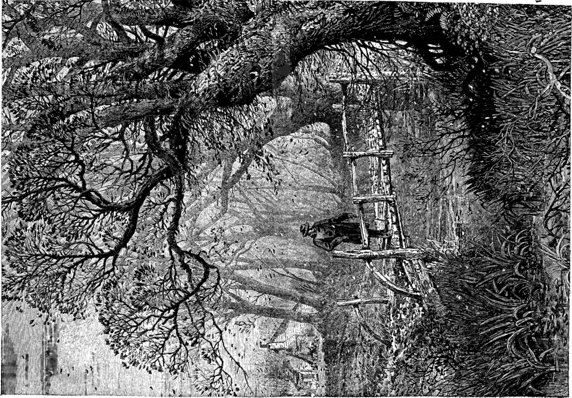
T ó m n a .