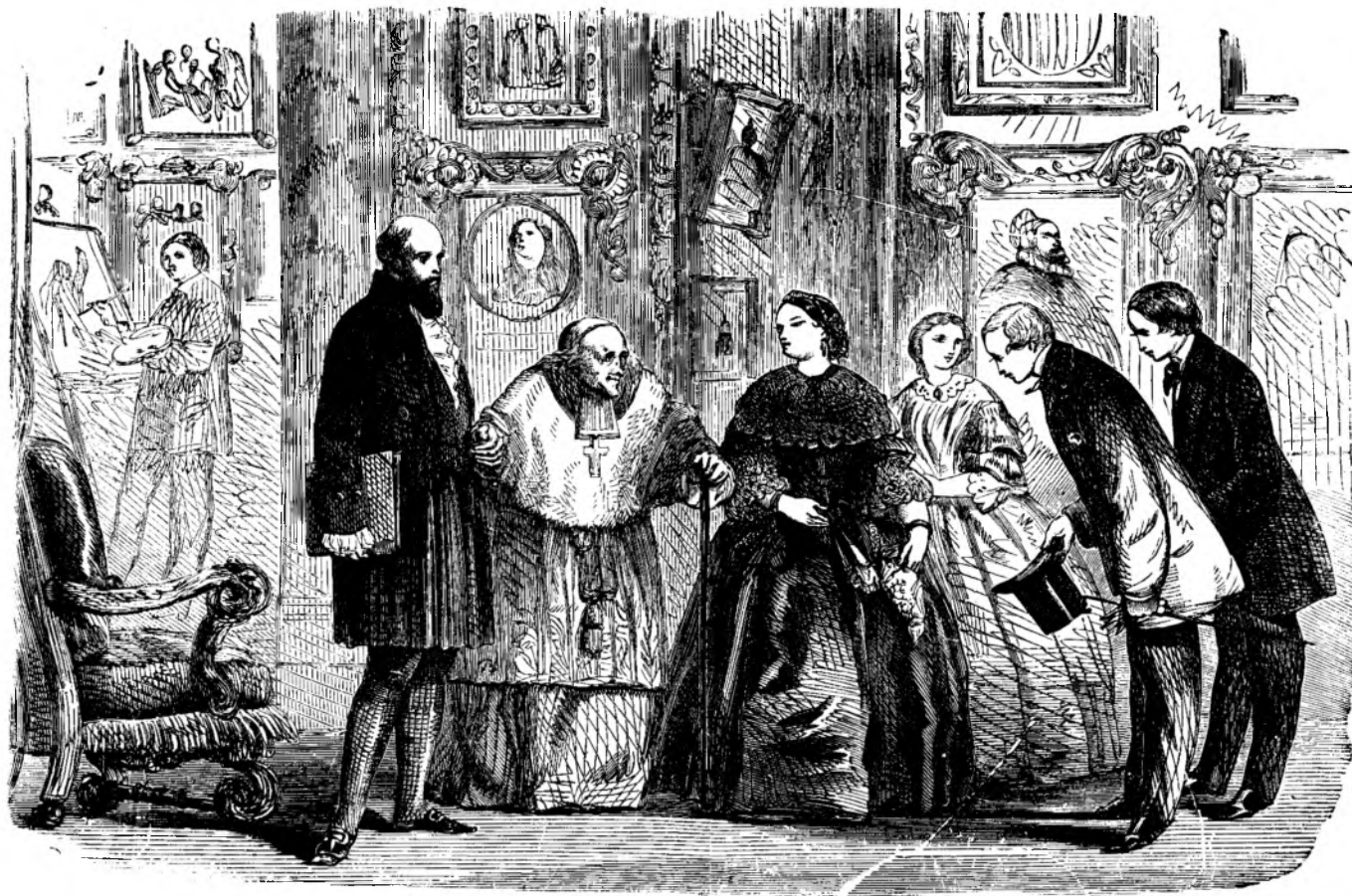
Când ei întrara la preotul, acolo deja așteptau două femei si unu barbatu.

Cum sè nu-l fi serbatu!? Acuma a devenitu dên- sul adevératu colegu al lor. Cum sè nu fi platitu el bu- curos!? Acuma credea, că a facutu celu mai bunu pasiu de când a venitu de acasa! Si cum sè nu fi primitu ca- maradii cu placere, când între toti numai Barbu avea parale?