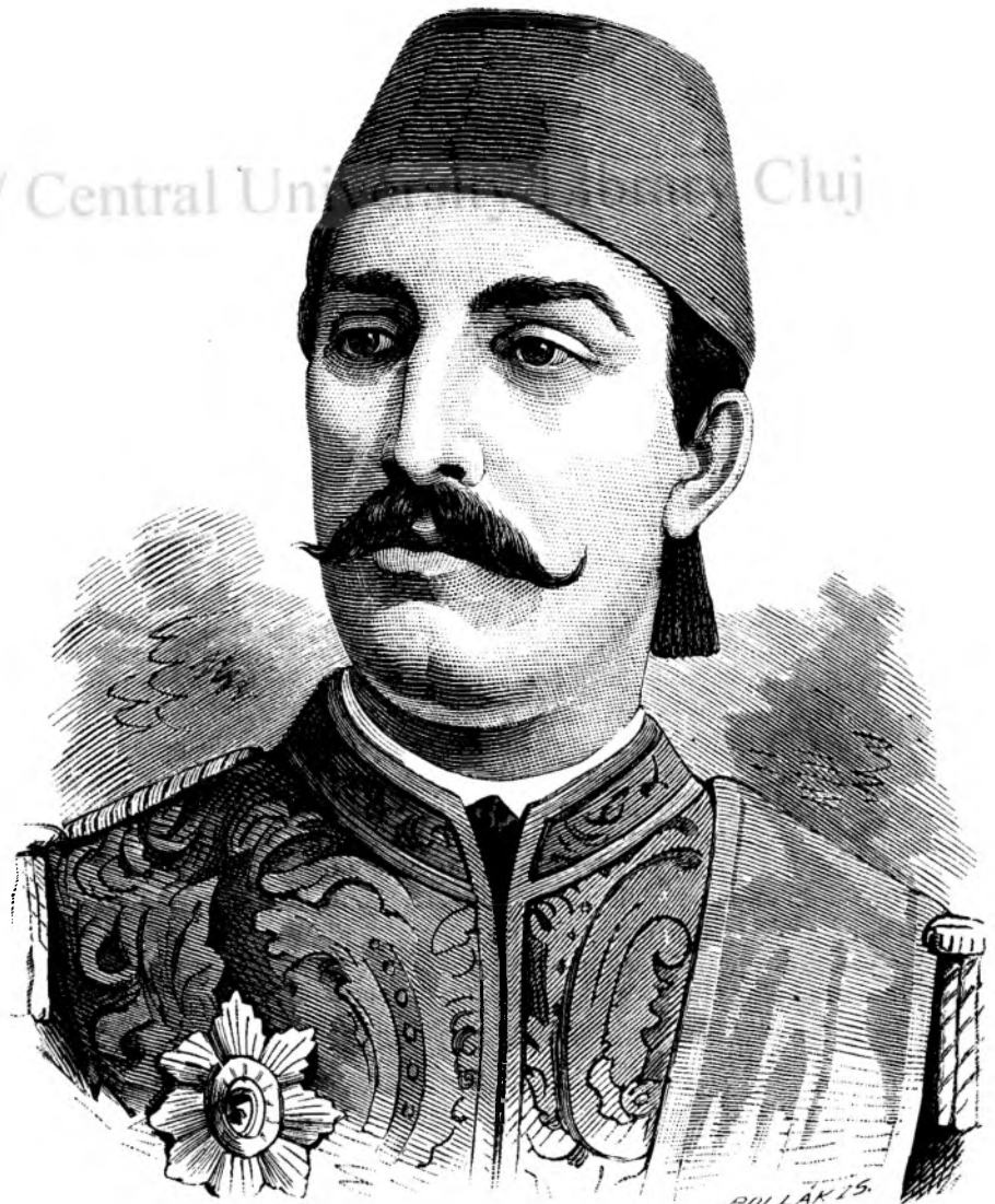
Tewfik I noul vice-rege al Egiptului.

Alegerea presiedintilor si a vice-presiedintilor numai pe câte unu anu — e numai o rapire de tiupu, ce deróga consolidării lucrurilor; si erá cu multu mai simplificatu lucru, déca — în locu de asiá numitii asesori — presiedintii secțiunilor erau totu-de-odata