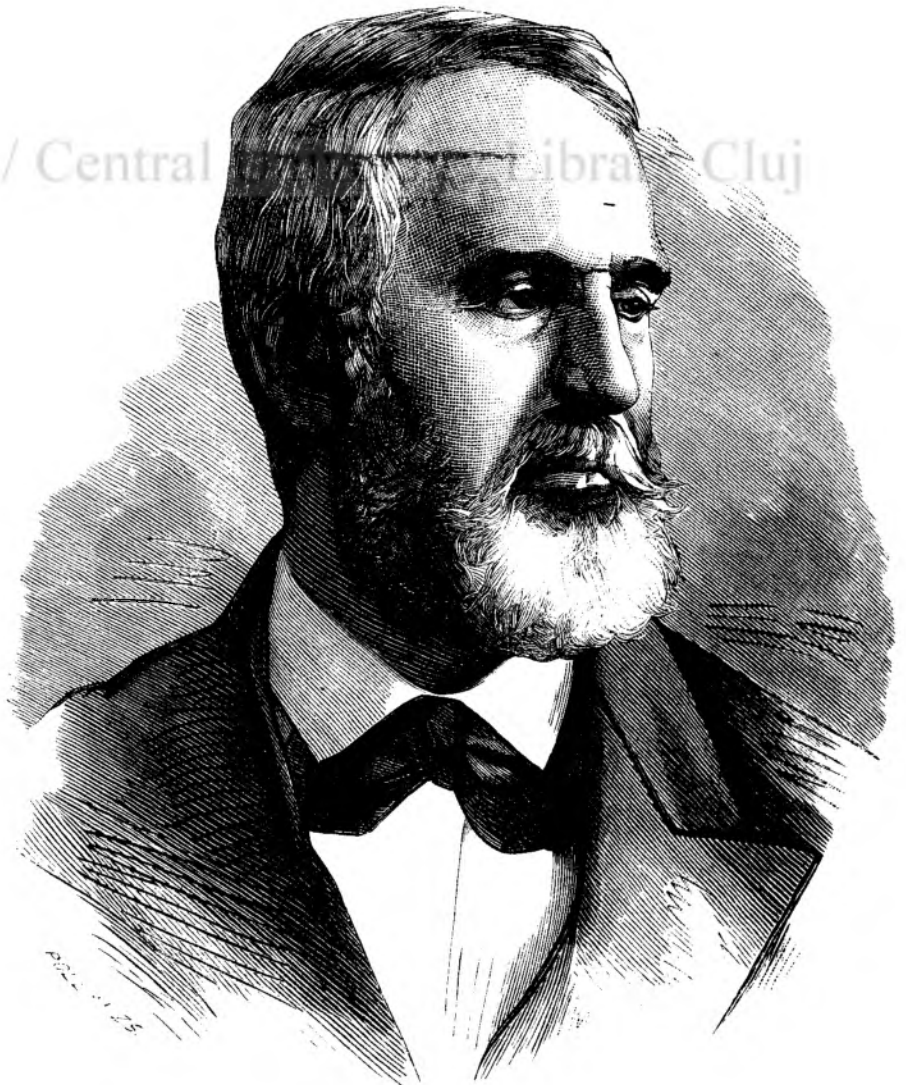
Aleco pașia, guvernatorul Rumeliei orientale.

— Déca voiesci să remâni în casele aste, îți oferu o odaia.