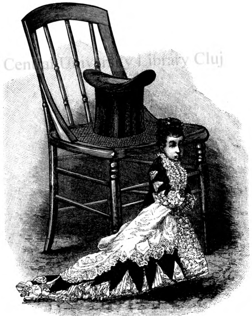
Cea mai mica feta in lume.