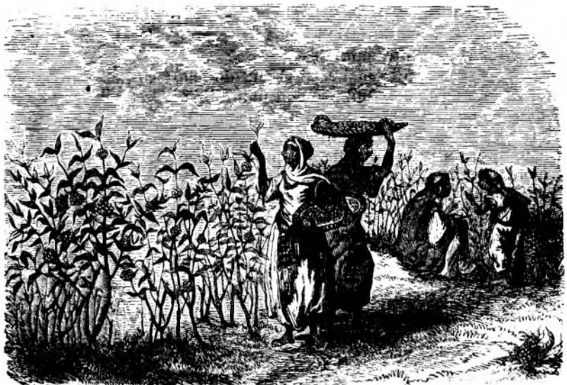
Culesu de theia în China.