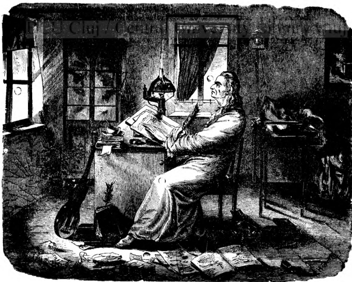
Schiller scrie põesia.

Traianu : Dómne feresce! Cum sè nu dau? Care e scopul patrioticu pentru care sè nu fiu contribuitu? Pung'a mea totu-de-una stă la dispozițiunea tierii mele. Înse tocmai în momentul acesta nu potu sè împlinescu dorint'a ta, care e si a mea. Chiar înainte de tine a fost la mine unu domnu, care m'a invitatu sè