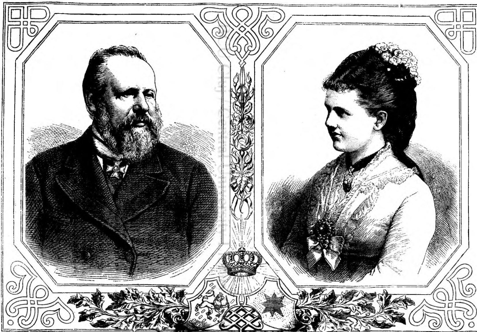
Vilhelmu III regele Hollandiei si principess'a Ema Waldeck-Pyrmont.