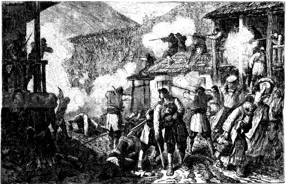
Lupta la o strimțóre în Hertiegovina.

102. Mitropolitulu României Dionisiu Lupulu , care pe la 1819, se interesă asiá de multu cu instruirea tinerimei, și primulu tramise cu cheltuiél'a sa juni din tíera cá sè studieze în