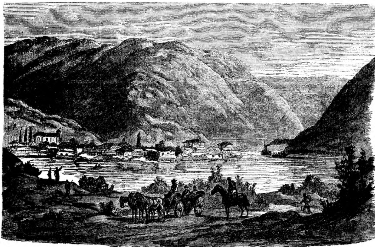
Ada Kaleh. (Orsiöva-nöua.)