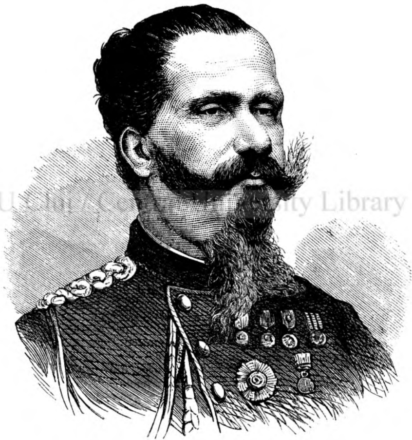
Victor Emanuel, regele Italiei. † 9 jan. 1878.

Ea își puse iute pe capu sialulu de calugaritia, care i ascunse perulu și fruntea, și, precum se îndreptă catra cabinetulu cu grathîi, luă drumulu spre usi'a de esîre.