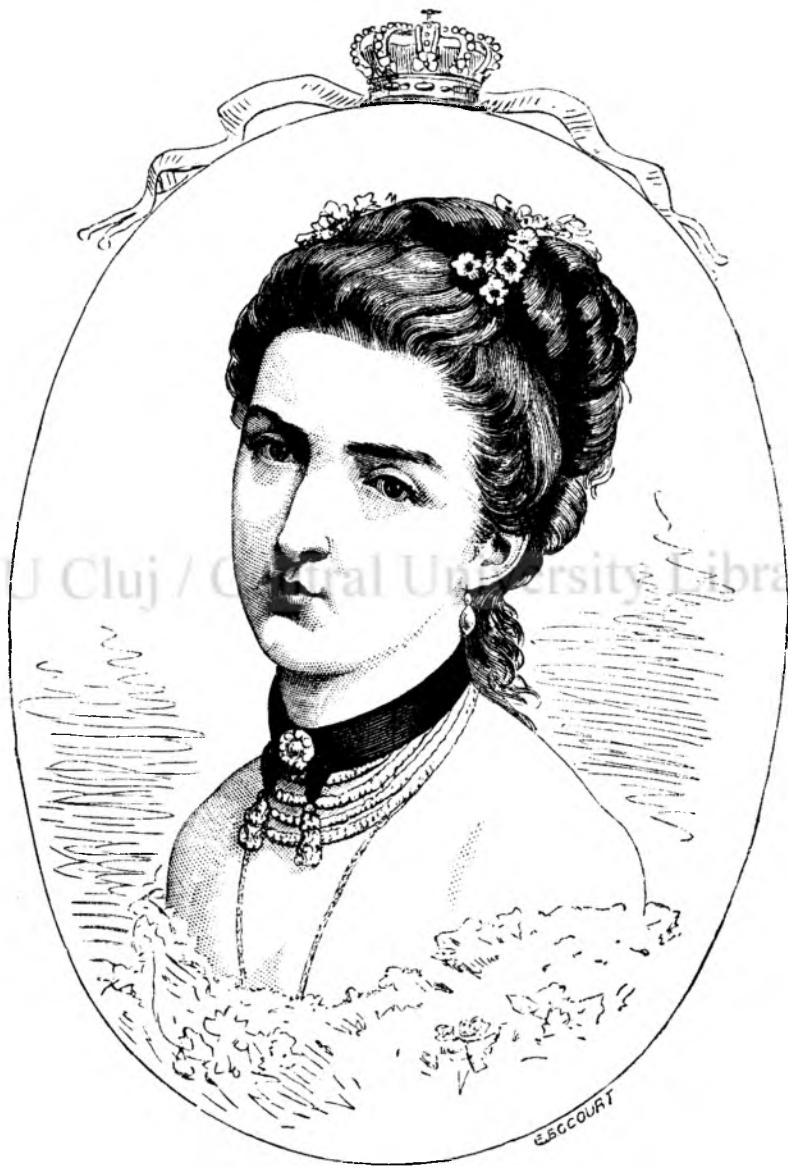
Margareta regin'a Italiei.