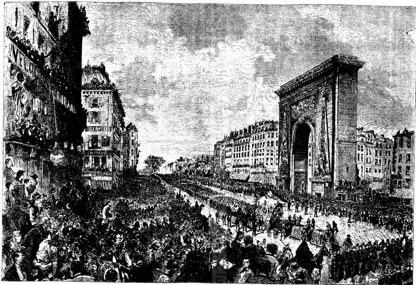
Inmormântarea lui Thiers in Paris.