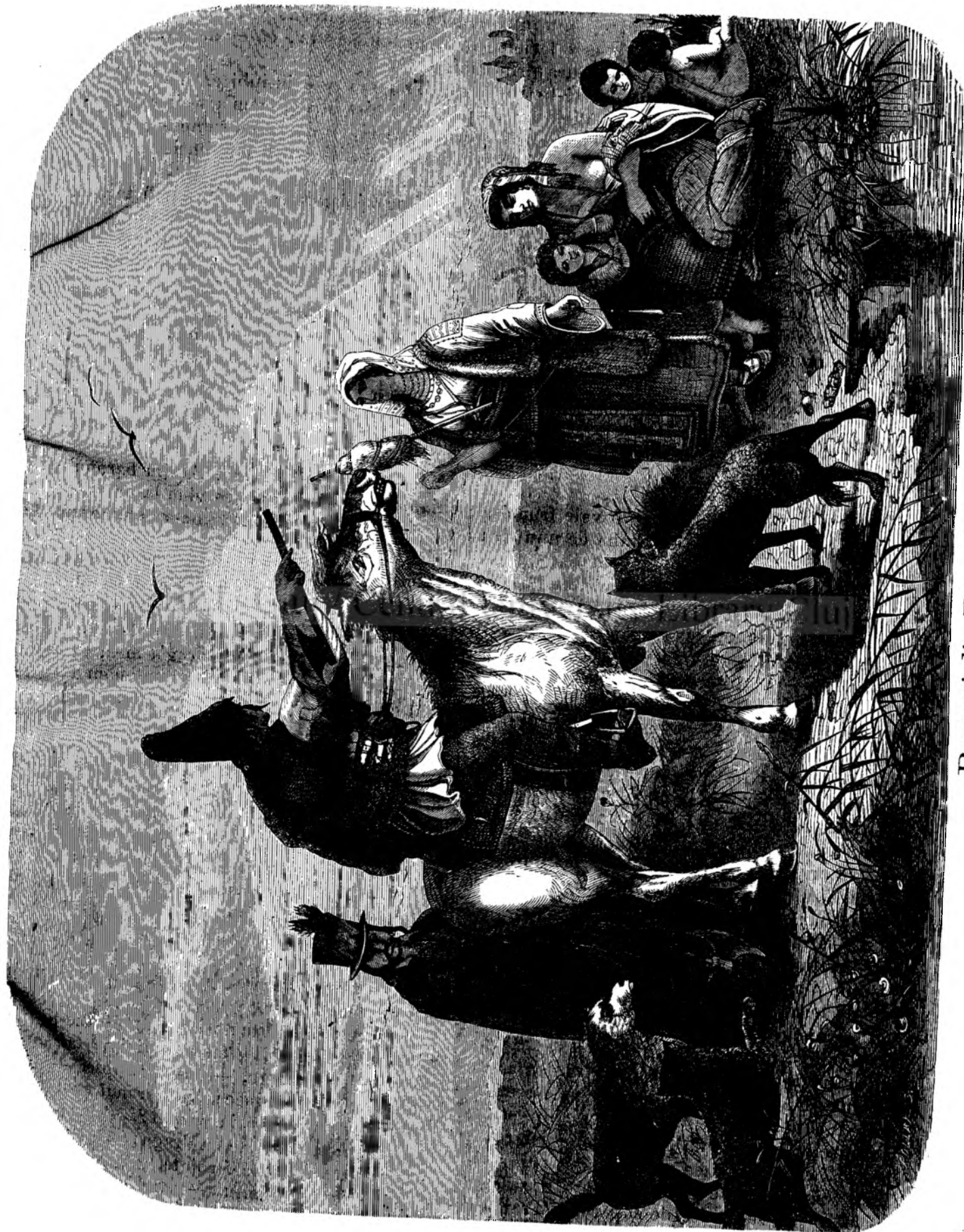
Romani din Bucovin'a.