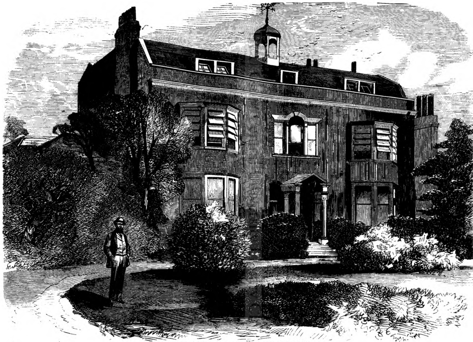
Locuinti'a lui Dickens (Boz) in Gads-Hill-Place.