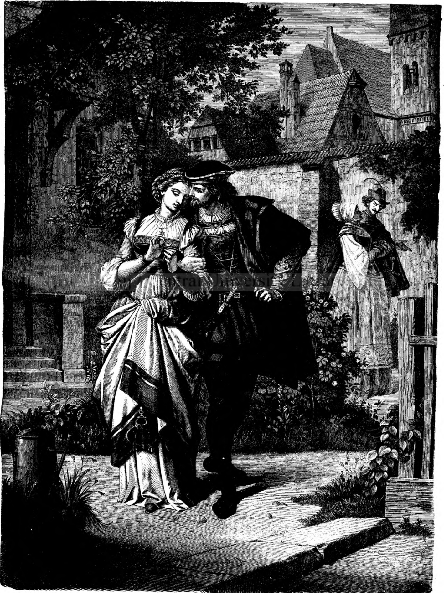
Faust si Margareta.