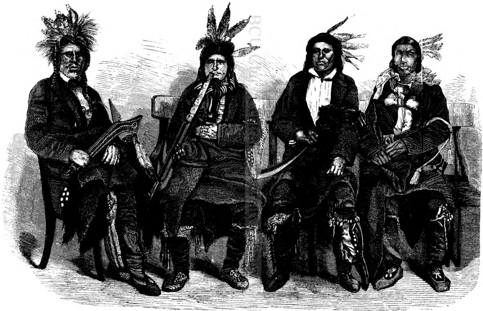
GUVERNATORI INDIANI IN NORD-AMERICA.