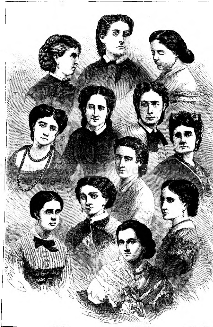
Princes'a Cristin'a Bonaparte. Princes'a Ana Murat. Soci'a gen. Mac Mahon. Marquise-a Gallifet. Imperat'es'a Eugeni'a. Princes'a Metternich. Princes'a Matild'a. D mn'a Carette. Princes'a Clotild'a. Contes'a Walewsca. Soci'a gen. Canrobert. Contes'a Pourtales.

Astu-feliu sê atîtiã betranulu;  r' Sinovi'a se parea c  singura er  convinsă, c  pr  curundu si-a desfasuratu nevointi'a, tacea ca muta, fara nici o lacrima, — ea care se pregatise la ac sta scena demultu.