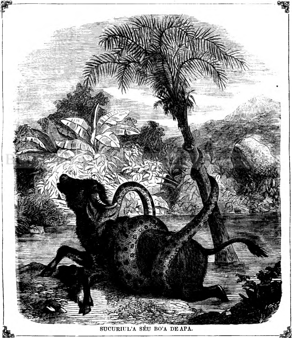
SUCURIUL'A SÊU BO'A DE APA.

nimicu din ruinele ei. Anim'a mea este ranita, ceriulu vietiei mele este intunecosu, tu poteai sê torni balsamu pre anim'a mea poteai sê luminezi nóptea vietiei mele. Eu te iubescu, si cu câtu te iubescu mai tare cu câtu me nesocotesci tu mai multu. Ti-aduci aminte de aceea nópte fatale in care ti-am redatu libertatea, nu ai uitatu promisiunile ce mi le-ai facutu? Recél'a ta