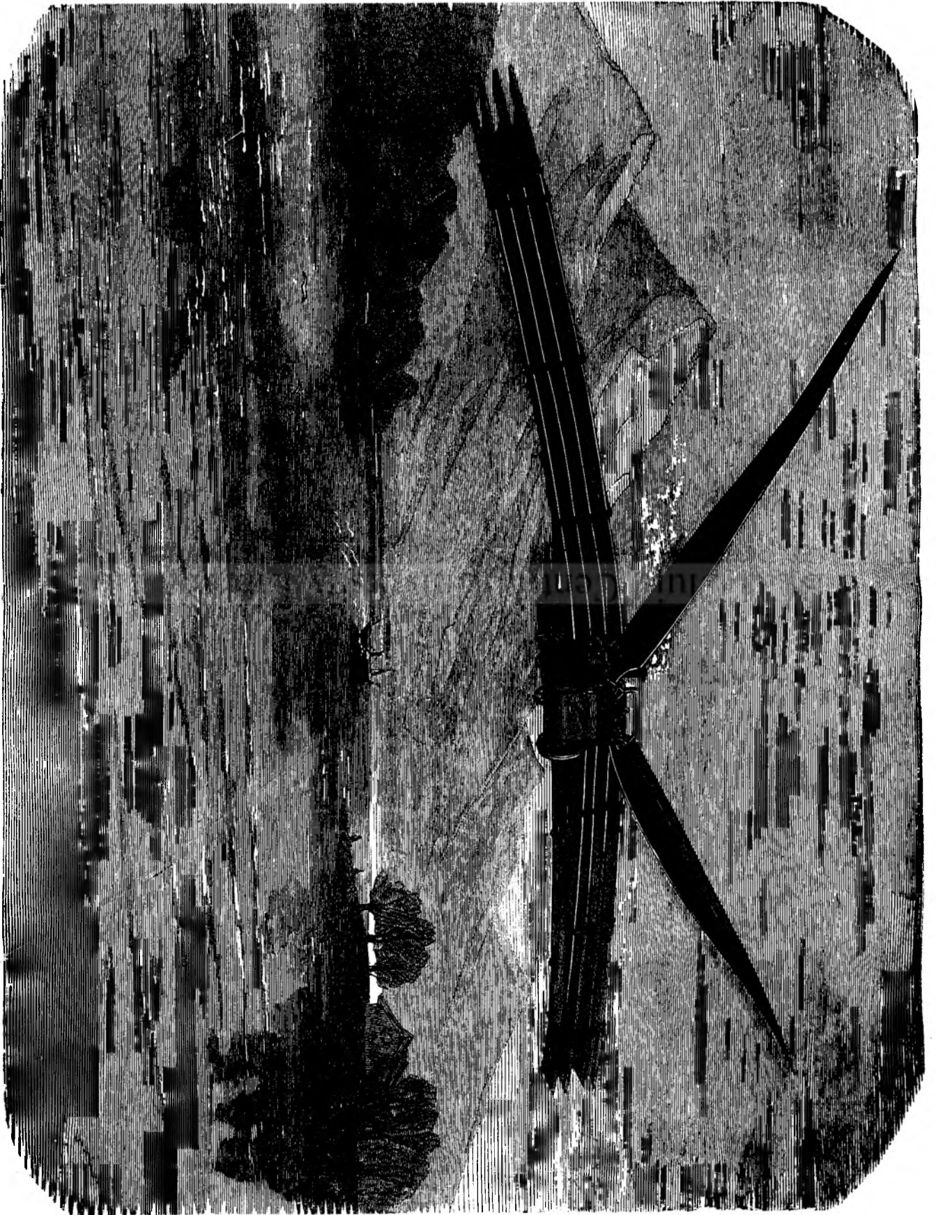
MASINA SPARATORIA A LITI KAPPMANN