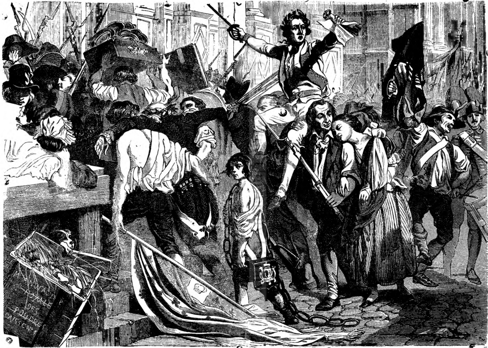
TRIUMFULU LUI MARAT.