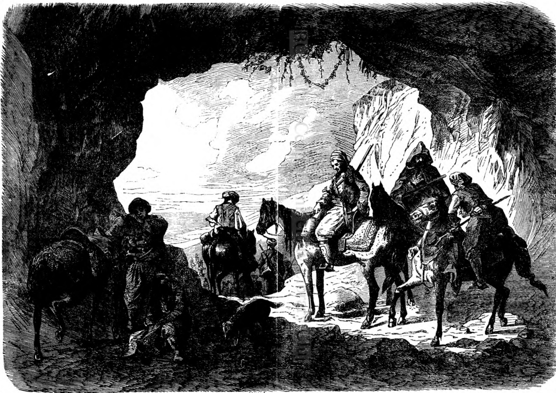
O ESCÓRTA IN BOSNIA.