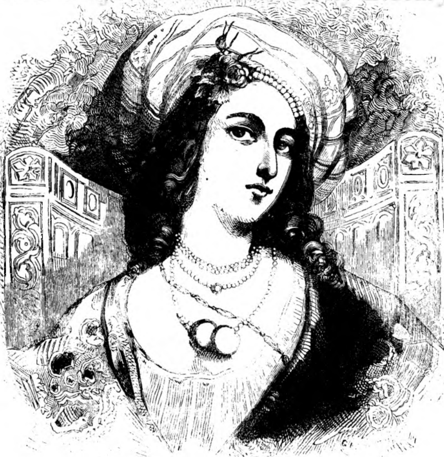
FEMEIA DIN HAREMU.

Pentru o orientare mai chiara inse reproducem aici cateva schitie despre