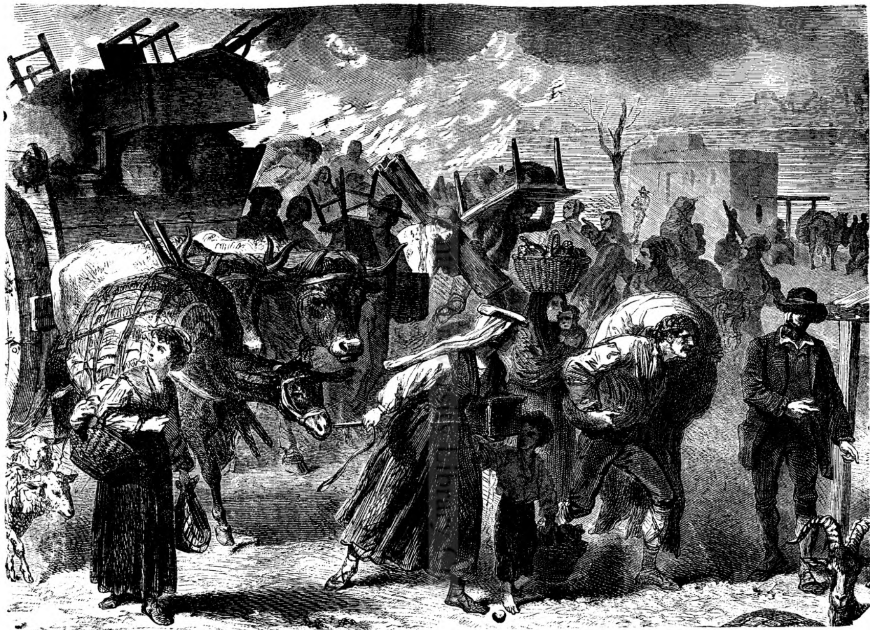
FUGA D'INAITEA LAVEL.