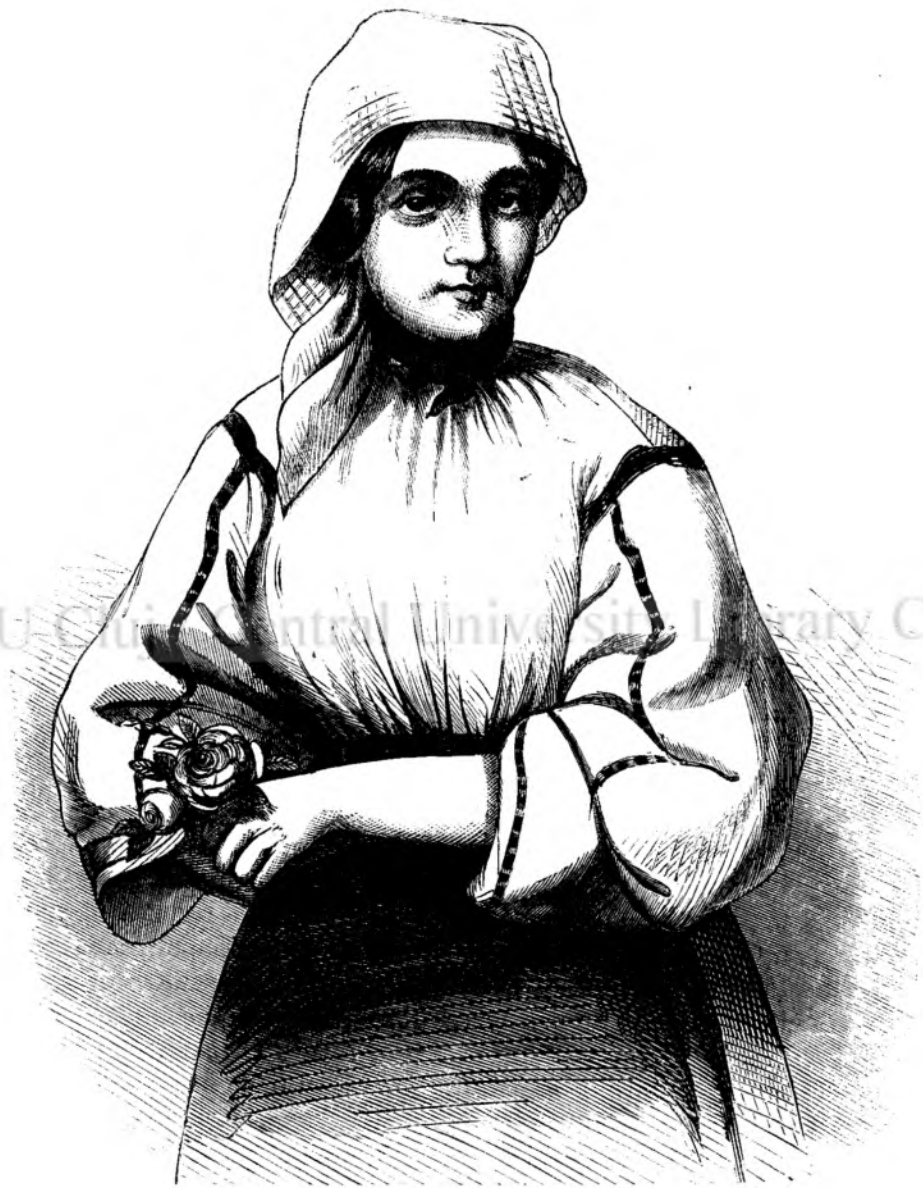
ROMANA DIN SALISCE.

— Scóla Decebale, regele braviloru — aduna taber'a daciloru, léga-ti armele de brau,