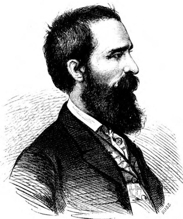
BOGDANU PETRICEICU HAJDEU.

Apoi serví câtu-va tempu, in intervalulu resbelulu de la Crimea, in regimentulu de husari, numitu contele Radetzky; dar pe de o parte vediendu-se persecutatu pentru inde-