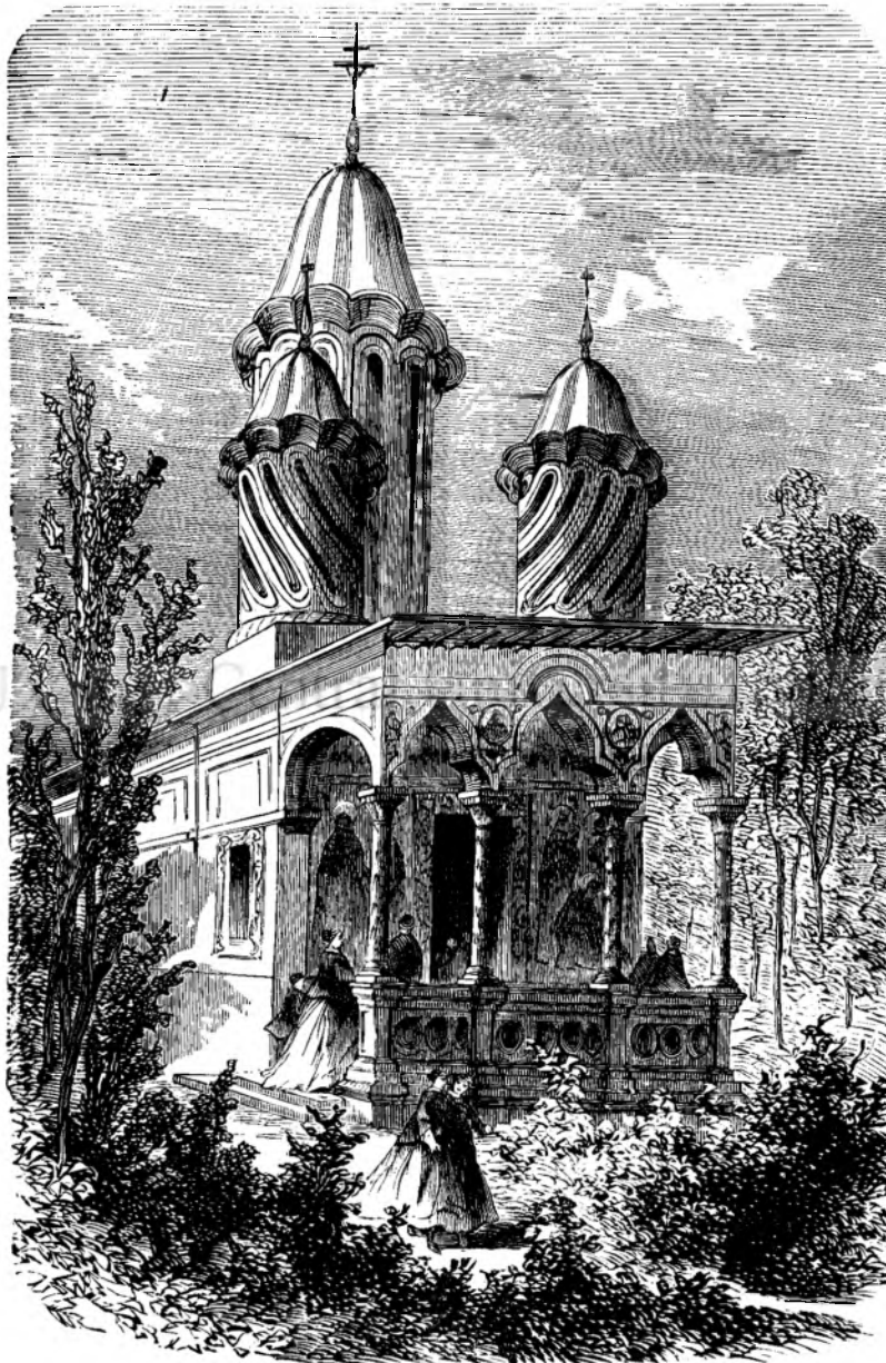
Pavilonulu Romaniéi la espusetiunea din Parisu.

au apusu dupa o scurta viétia, parte dinlips'a prenumerantiloru, parte suprimate prin boiarii fanarioti de la putere, ca Curiosulu , ca Progresulu etc, totusi pe la 1848 aveamu inca 15; éra la 1850 aveamu 31, dî treidiece si un'a gazete si foi periodice. De atunci incóce, déca nu a crescutu diurnalistic'a nôstra in numeru, luandu afara unele provincie, ca Ardélulu si Ungaria , a crescutu inse in autoritate si insemnatate. Destulu a indrumá ací la foi, cum erá Romani'a literaria de Alesandri , Ste'u'a Dunarii de Cogalnicénu , Revis'a romana de Odobescu si consocii etc. séu cum este astadi: Romanulu fundatu la 1855 de C. A. Roseti , care luà mare auto-