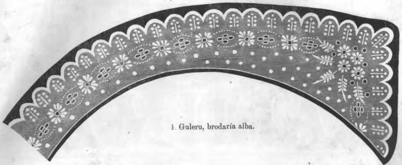
1. Guleru, brodăria alba.