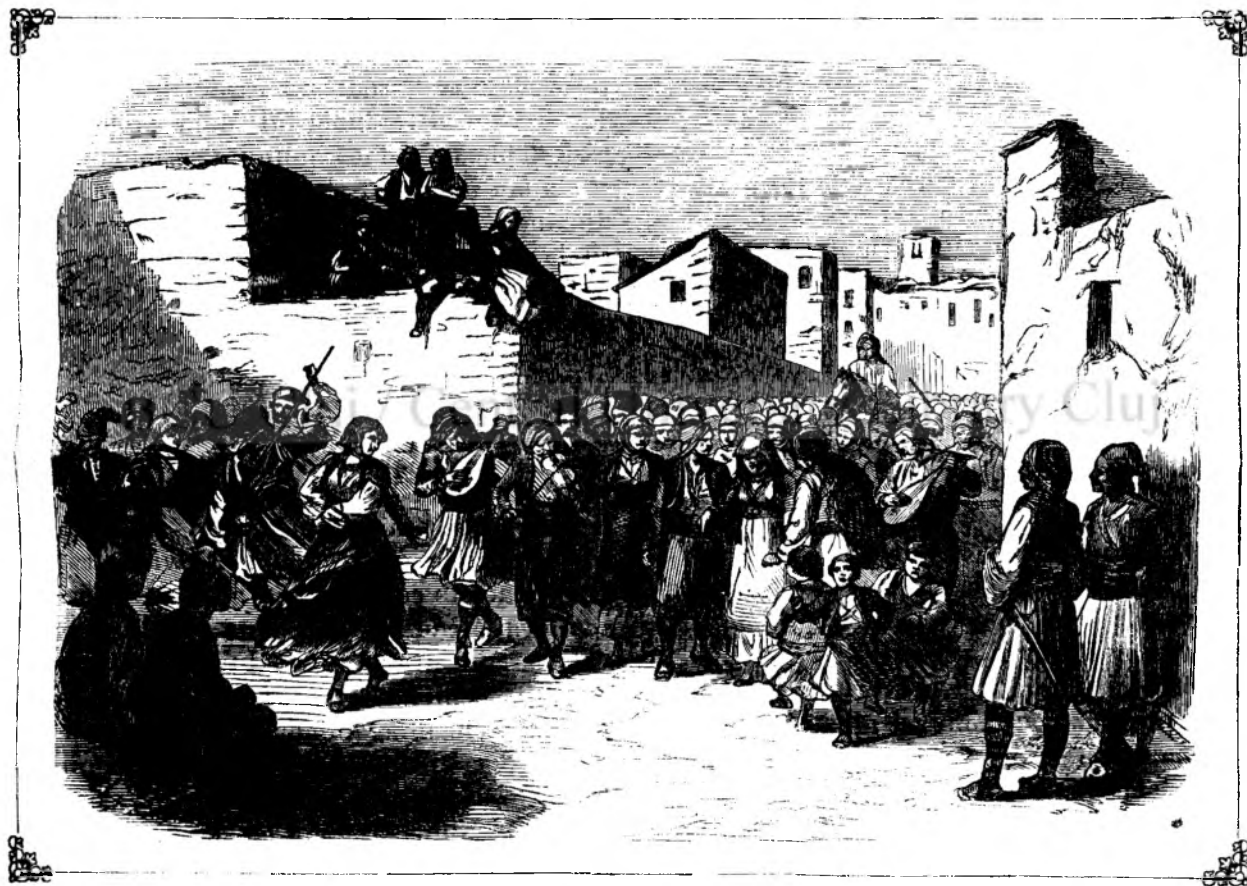
O nunta in Elensis. (Vedi pag. 104.)

Dupa lupt'a din codrulu Racovii s'a intorsu Stefanu la Sucéva, s'a plecatu 'naintea princesei lui Radulu si a cerutu man'a Mariei. — Princes'a s'a convoitu, in speranti'a si interesulu pazei, binelui romanu, si preste câteva dile Vochitia binecuventá pre Stefanu si Maria.