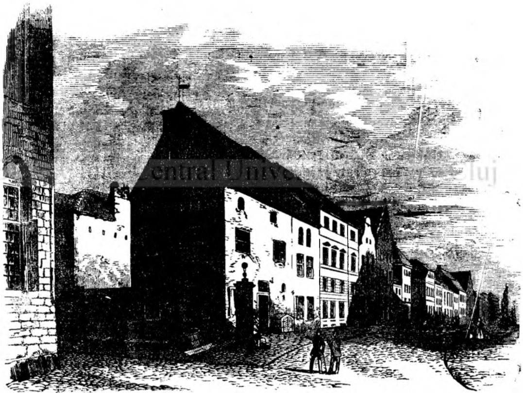
Cas'a nascerei lui Copernicu in Thorn. (Vedi pagin'a 391.)

„Nime nu e fericitu pana cand vietuieste!“ a disu marele filosofu Solon si acêsta asertiune a sa s'a si adeveritu precum seimu din istori'a nefericitulu Cresu. — Asié dara indesiertu