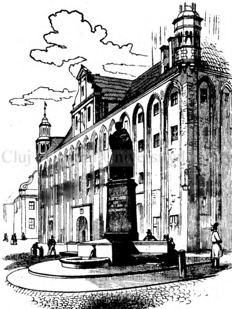
Monumentulu lui Copernicu. (Vedi pagin'a 391.)

Cutare manca bucatele cele mai simple, se nutresce dupa ostenél'a sa propria, si se imbraca in vestminte facute de elu insu-si — si e feri-citu; — cutare si cutare éra e impodobitu cu cele mai pompóse vestminte din tieri straine, si