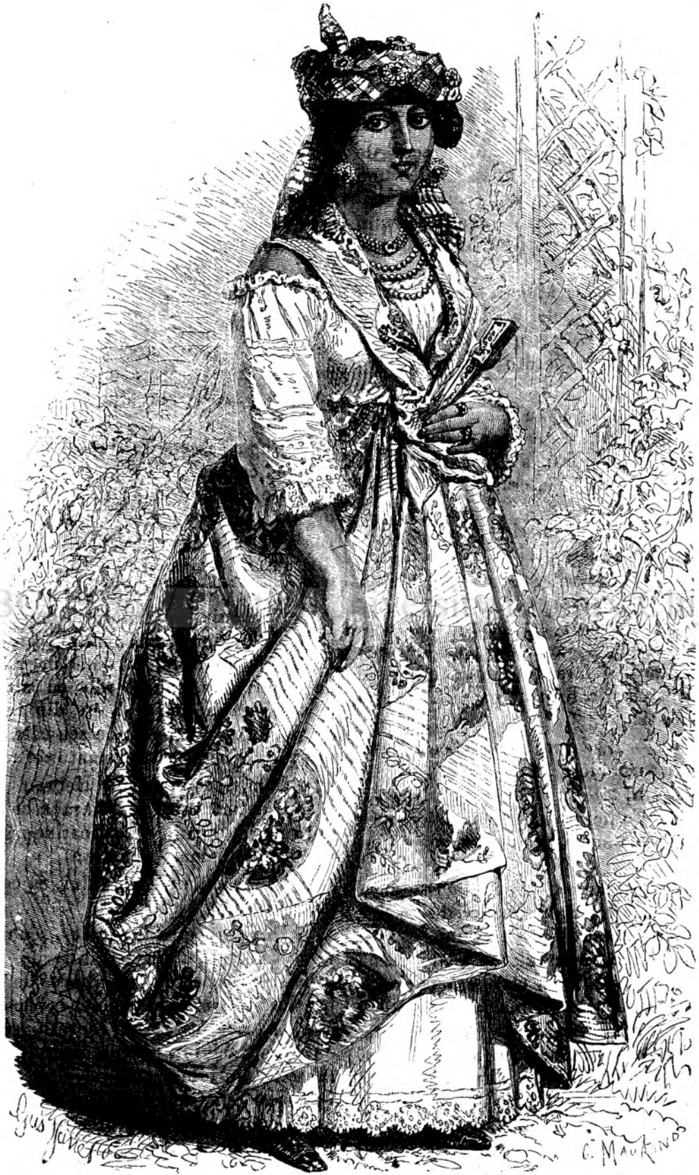
Femeia de mulatu. (Vedi pagin'a 297.)