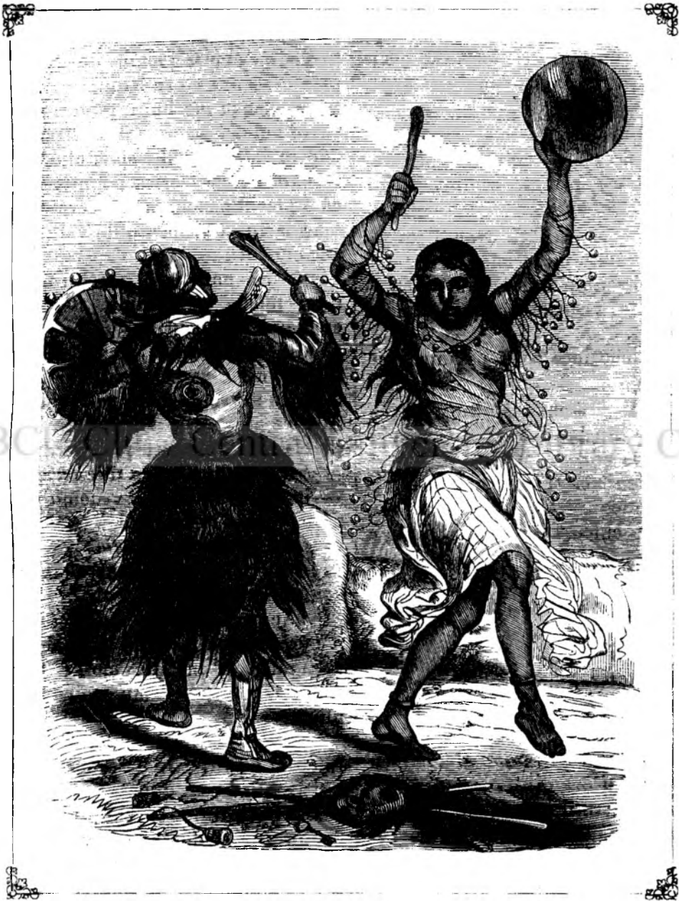
Siamane jocatóre la Jacuti. (Vedi pagin'a 212.)

O vorba blanda, o privire amorósa adeseori e in stare a departá in momentu ghiati'a ce