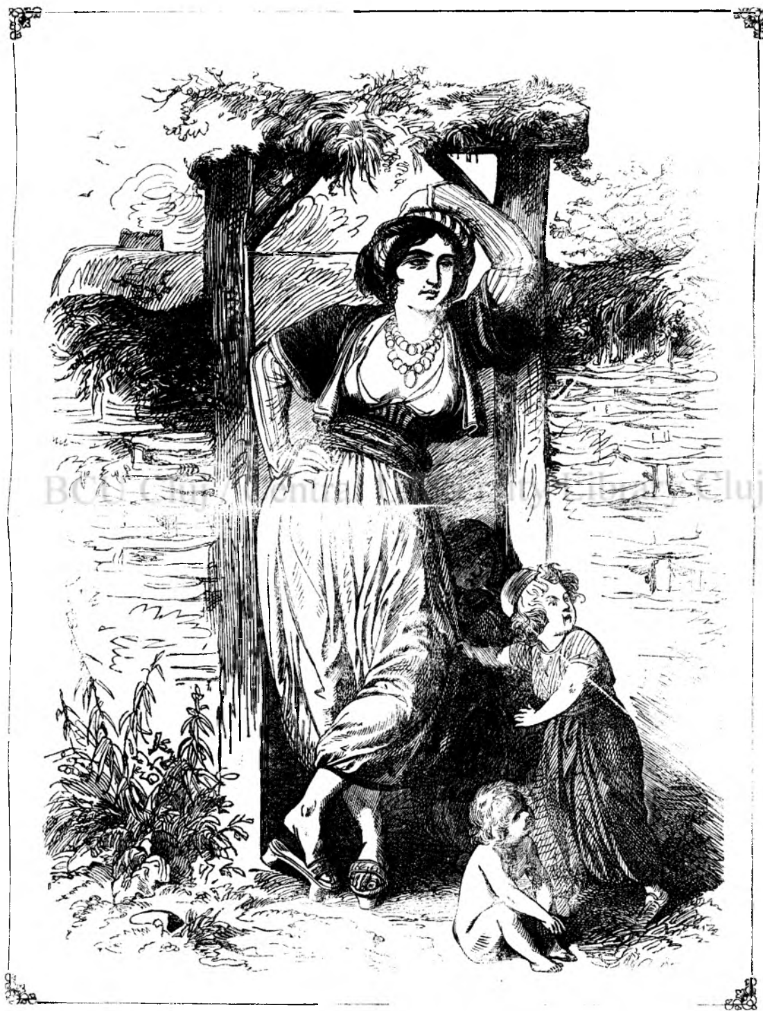
O crescina turca in Silistria (Vedi pag. 128.)

unu calugaru desperatu? Pote ti-pute innainte fumulu pulberelui de pusca si ti s'a coboritu curagiulu in tureci? Hei copilandre! cu astufeliu de curagiu nu se liberedia patri'a! Incai de ai bé, cá dora ti-ai mai capetá curagiu.