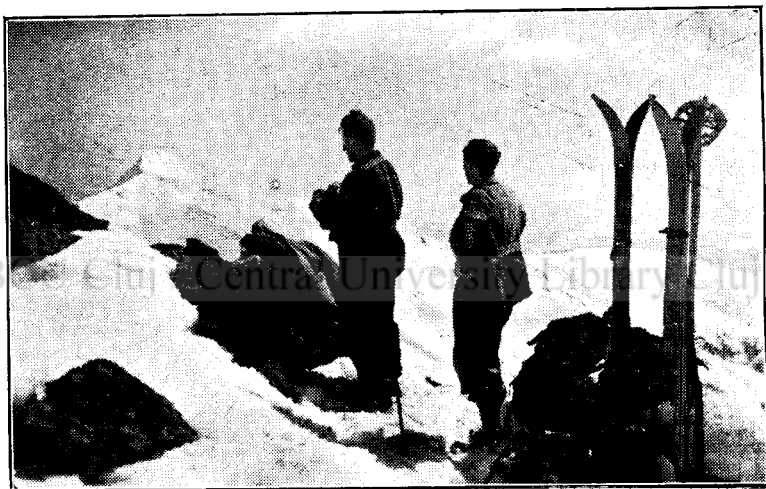
A Várful Roşu napfényben.

Ekkorra már teljesen megvilágosodott s a felkelő nap pajkos sugarai megkezdtek csillogó játékukat a jéggé fagyott hómezőn. Egy meredek oldal van még a gerincig, amit rendes körülmények között rövid idő alatt szoktuk megtenni, de ez alkalommal keserves lassúsággal haladtunk előre. Ugyanis bár hatalmas hóréteg borította a gyephavasi oldalt, lécsötéséről szó sem lehetett, mert a hó csonttá volt fagyva. Itt egy száz méteres távon átszenvedtük a könnyelmű természetjárók minden keserűségét. Igen, mert nem gondoskodtunk a magas hegységeken nélkülözhetetlen hágóvasakról. Egyikünk, aki sok alpesi kirándulásán szerzett tapasztalatai folytán birtokában volt egy könnyű