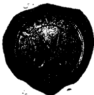
A KOLOZSVÁRI SZABÓCÉH PECSÉTJE 1548-BÓL.

1718-ban újból renováltatta a város, amely alkalommal «a tiszteletes tanács ó kegyelme parancsolatjából a becsületes céh vénségei is egybegyültek, hogy az bástya építése iránt jó dispositiót tegyenek». Az átalakítás azonban teljesen a város költségén ment végbe és ettől kezdve a bástyának nemcsak védelmezésétől, hanem fenntartásától, sőt tulajdonjogától is elesett a szabók céhe, mely a város védelmezésével kapcsolatban annyiszor felelt meg az ősidők óta reá rótt nemes kötelességnek. Ezek az érdemek kimentek lassankint a köztudatból is s innen van az, hogy később, midőn a szabók egykori bástyájának jelentőségét is elfeledték az emberek, a torony is nevet cserélt és a rajta levő emléktáblának felírata alapján Erdély legnagyobb fejedelméről Bethlen Gáborról Bethlen-bástyának nevezték el az egykori szabók tornyát Kolozsvár polgárai.