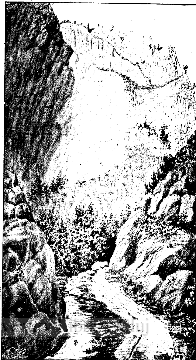
Solymássy A. rajza.

A ki inkább a büszke tetőkre tekint, mint az alj növényzetére, az sem bánja meg, hogy idejött, mert a rézhámorral szemben gyönyörű kilátás esik a Nagy-Kőhavasra , mely különben e gyönyörű szoros nem első megragadó pontja és Alsó-Tömös felé haladva, szebbnél szebb képekben van módjában gyönyörködni. Utóbbi helyen hozzánk csatlakozott vezetők és a honvédelmi megsemlélése után, Alsó-Tömös előtt nyugotnak kanyarodva, útunkat a fenyvesbe vettük, a mely itt még vegyes lombfákkal, a mint azonban a Tetőfoi -felé haladva magasabbra emelkedünk, kizárólag fenyőkből áll, a mely fenyő-erdő kopasz, csak sárga csuszós tüleveivel fedett alja kirívó ellentétben van a lomberdő vi-