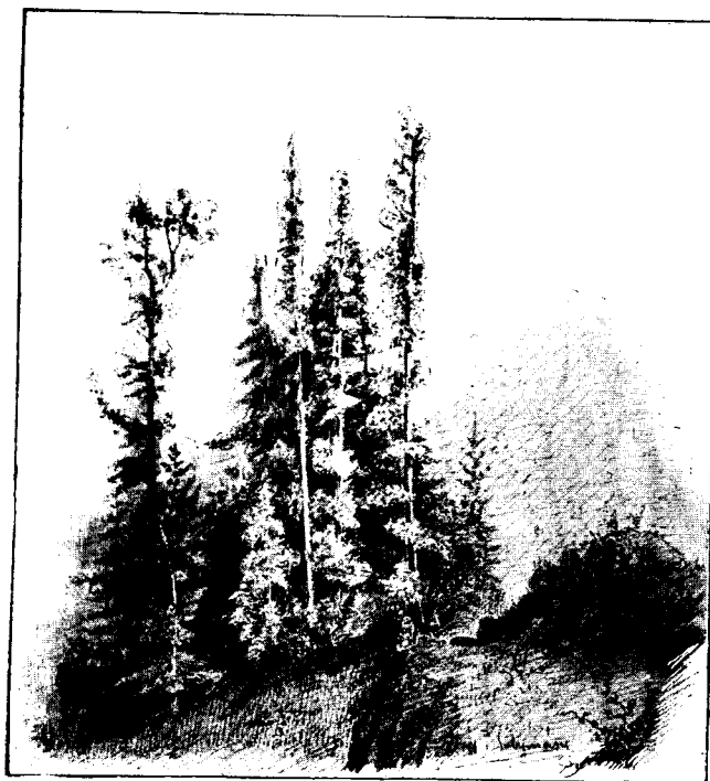
Solymássy A. rajza.

A vízvázastóról szép kilátás nyílik a Bucsecsre , a melynek egyes hasadékaiban fénylik még a hó, míg tetejét komoly felhők kezdik fedni. Lejebb ereszkedve a szénásokon kísér a tücsök danája, a szöcskék zörgése és az ér halk moraja, melynek szélét gyönyörű nagy virágú Epilobiumok és az Aconitum moldavicum