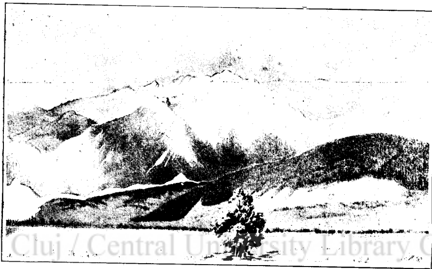
Solymássy Adolf rajza.

Kincset birunk mi városunk fekvésében, vidéknek remek szépségében, s bár e kincs nincsen elrejtve