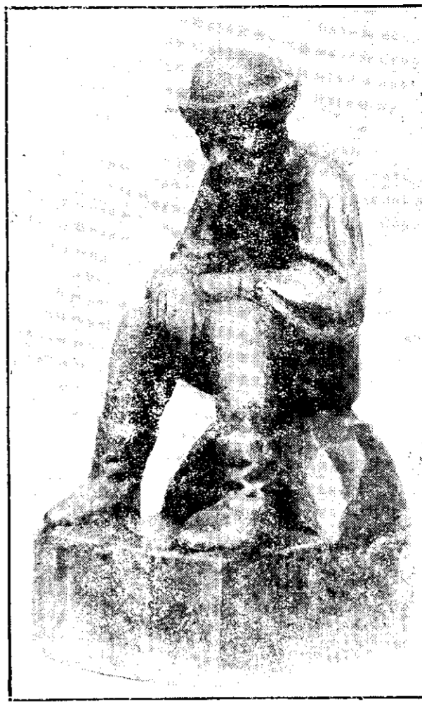
După muncă — de I. Gheorghiuță