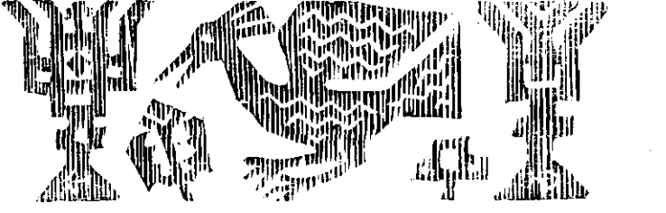
Xilografie. de I. Gheorghijă