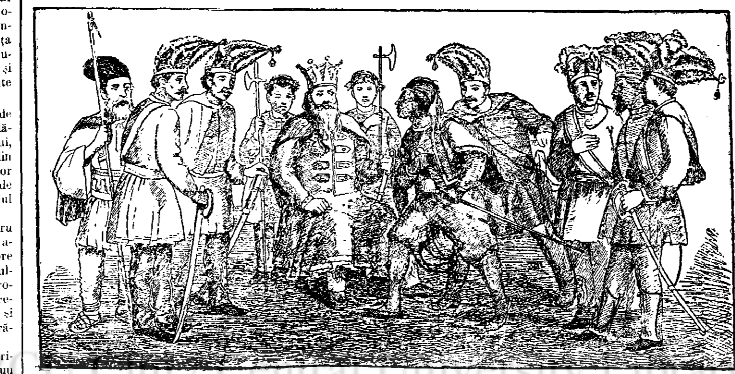
JOCUL ÎROZILOR ÎN CĂȘLEGELE DE IARNĂ