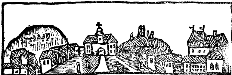
Blajul cel vechiu

BCU Cluj / Central University Library Cluj